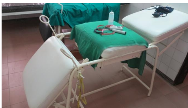
Leje obstetrisk afd. privatklinikken "Boni d'Akpakpa"

Manglerne på hospitalerne var stort set af udstyrs-mæssig karakter. Kort kan siges, at man alle steder har mangel på alt, bortset fra den dyreste privatklinik Boni d'Akpakpa, som er mere velforsynet.