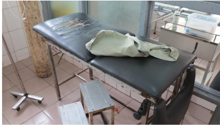
Leje obstetisk afd. CNHU

fuldstændig til det vi så, f.eks. kødannelse pga. manglende apparatur. Vi så operationsstuer, der manglede anæstesiudstyr og ordentlig belysning, og fødelejer, der var så defekte i polstringen, at de var helt uacceptable. Men det var hvad man havde.