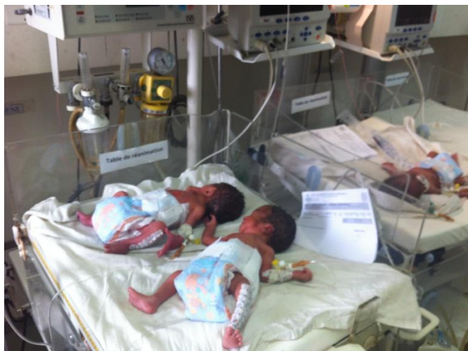
Neonatal afd. HOMEL

afdeling vi så (HOMEL) havde som nævnt relativt godt udstyr, med kuvøser ilt, sug og sondeernæring med udmalket mælk. Der var tæt overvågning og børn på ned til 800 gram. En sådan lille patient, der var inficeret, fik taget lumbalpunktur, da vi var på stuen.