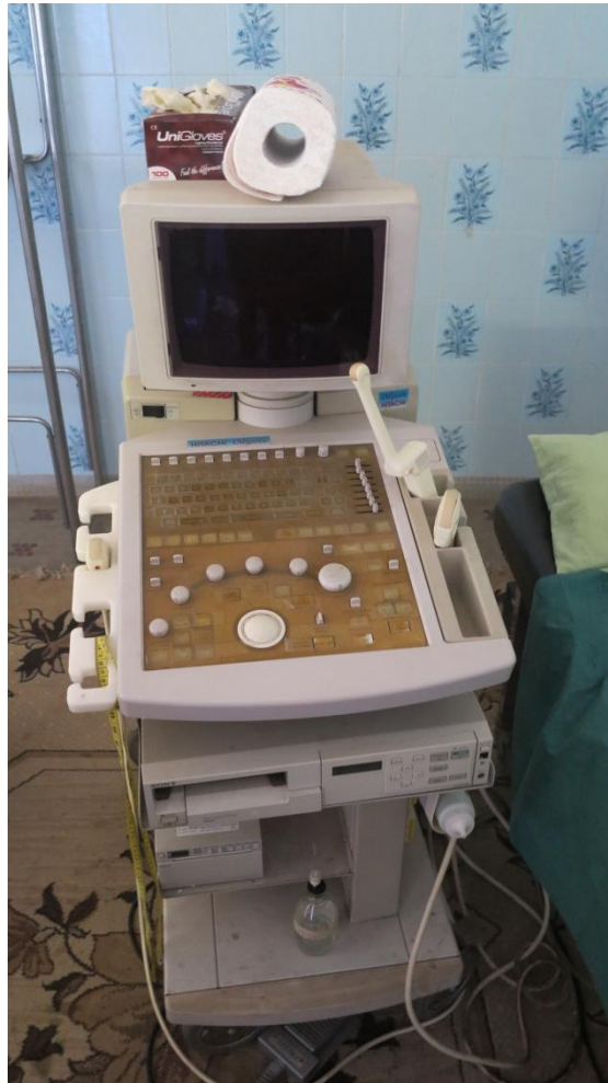
Ultralydsapparat fra jordemoderkonsultationen

men brugbare apparater) og et fagligt godt niveau hos de jordemødre, der foretog scanningerne.