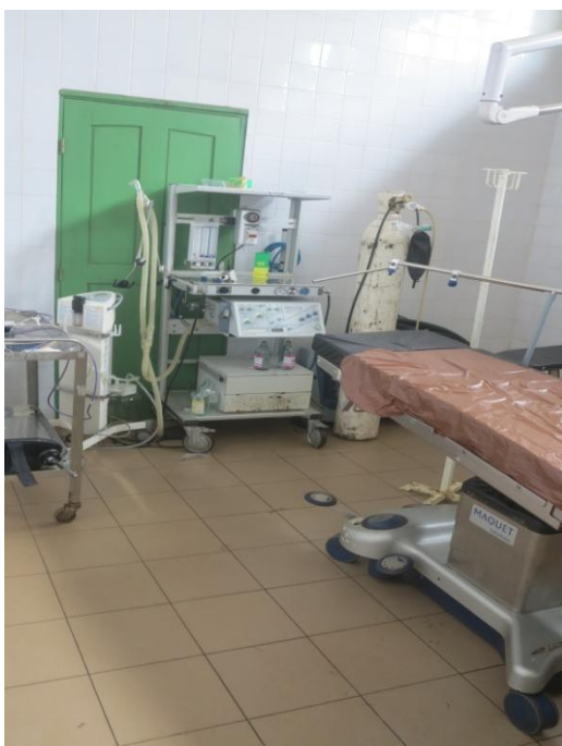
Udtjent anæstesiapparat på Hôpital de Menontin

På de mindre hospitaler var der stor mangel på operationsfaciliteter, så akutte sectioner (kejsersnit) måtte vente på, at den elektive (planlagte) operation var afsluttet. Den generelle materialemæssige situation var den samme.