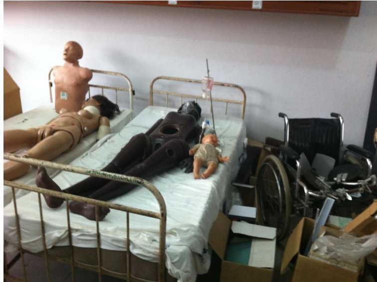
"Fantomer" på Jordmoderskolen i Cotonou

Skolerne i Cotonou, der varetager jordemoderuddannelsen og sygeplejerskeuddannelsen har lokalfællesskaber, og ledes hver af en læge.