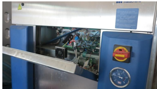
Defekt autoklave CNHU

Generelt beholdt man dyrere udstyr, som var defekt, i afdelingen, hvis det, man nu klarede sig med "gik ned", kunne det defekte måske alligevel ordnes.