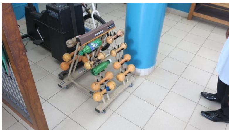
Håndvægte i fysioterapi (Man er kreativ når man mangler noget)

Ortopædisk bandageri fremstillede kun ”pyntepoteser”. Protesesoklen var taget efter afstøbning, men man manglede kunstige led, så lår, ben og fod var støbt i ét. Det var dog en bedre løsning end den, man så i gadebilledet, hvor mange manglede lemmer, og hvor dobbeltamputerede kørte på skateboard med to træklodser til fremdrift. Fysioterapien havde et udmærket træningsbassin, som dog ikke var i brug, da pumpesystem og rensningsanlæg var defekt.