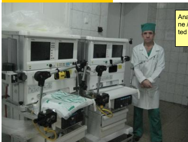
Anæstesiapparat doneret til Ukraine / Anesthesia equipment donated to the Ukraine

Artikel til Wikipedia er nu udarbejdet og vil snarest blive færdigredigeret og ajourført.