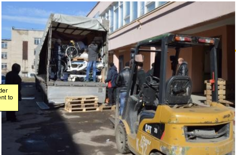
Doneret udstyr til Ukraine under aflæsning / Donated equipment to the Ukraine being unloaded

Article for Wikipedia has now been created and will shortly be finally edited and updated.