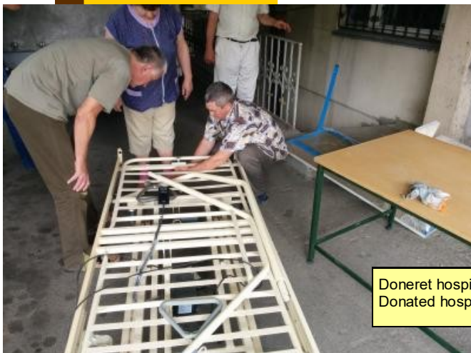
Doneret hospitalsseng i Ukraine / Donated hospital bed in the Ukraine

Nogenlunde, svag, men stabil, som følge af øgede indtægter og mindre udgifter, men det ekstraordinære blodfraktioneringsprojekt har medført en ekstraordinær, ikke dækket udgift. Øgede besparelser, bl.a. ved modtagernes betaling af fragtudgifter, er nødvendige, medmindre indtægterne øges væsentligt.